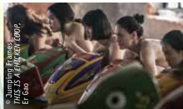
© Jumping Frames THIS IS A CHICKEN COOP, Er Gao