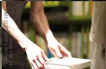
© Jumping Frames, LESS SIMILAR LAI, Alan Wong