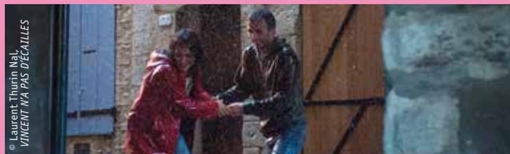
© Laurent Thurin Naï, VINCENT N'A PAS DE CAILLES