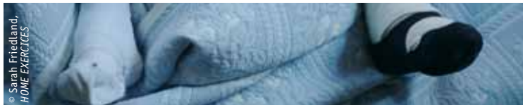
HOME EXERCISES