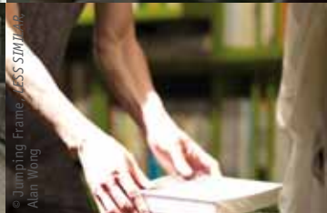
© Jumping Frame, LESS SIMILAR, Alan Wong