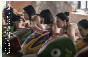
© Jumping Frame, WELCOME, THIS IS A CHICKEN COOP, Er Gao