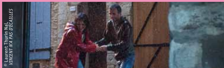
© Laurent Thurin Naï, VINCENT N'A PAS DÉCALILLES