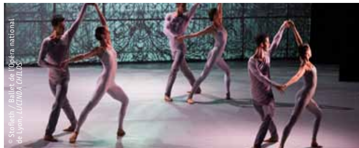
Ballet de l'Opéra national de Lyon, LUCINDA CHILDS